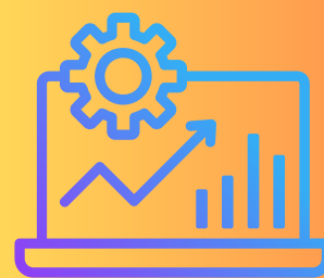
PERBANDINGAN JUMLAH RCP TAHUN 2021 HINGGA 2023

Pelaksanaan SNAS bermula tahun 2021 sehingga kini melibatkan 2 klinik kesihatan dan 8 klinik desa. Berdasarkan statistik jumlah RCP tahun 2020 (371 pesakit), terdapat peningkatan signifikan setiap tahun dari segi kehadiran temujanji RCP berbanding sebelum sistem ini dipraktikkan. Jumlah RCP dijalankan mengikut tahun adalah tahun 2021 (518 pesakit), 2022 (801 pesakit), dan 2023 (605 pesakit).